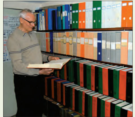
N-G. bland sina pärmar