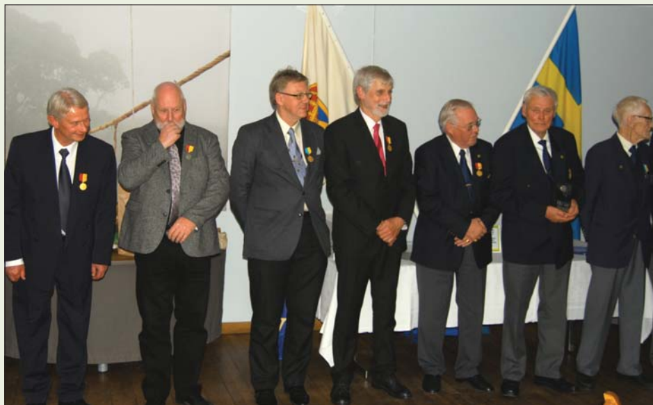
En grupp medaljörer